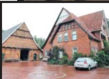
Auf diesem Hof in Ankum fand das Shooting statt